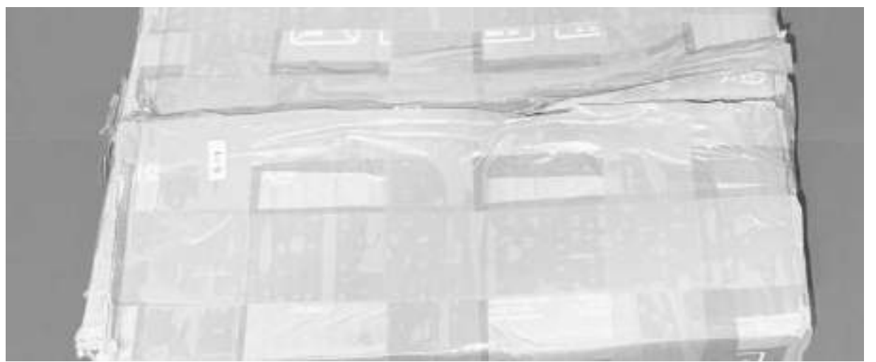
BARANG bukti sabu-sabu, saat diamankan di Mapolresta Palu, Minggu (19/4/2026).

Warga berharap tragedi ini menjadi titik balik, agar keselamatan publik tak lagi dipertaruhkan oleh kelalaian yang seharusnya bisa dicegah. ❏