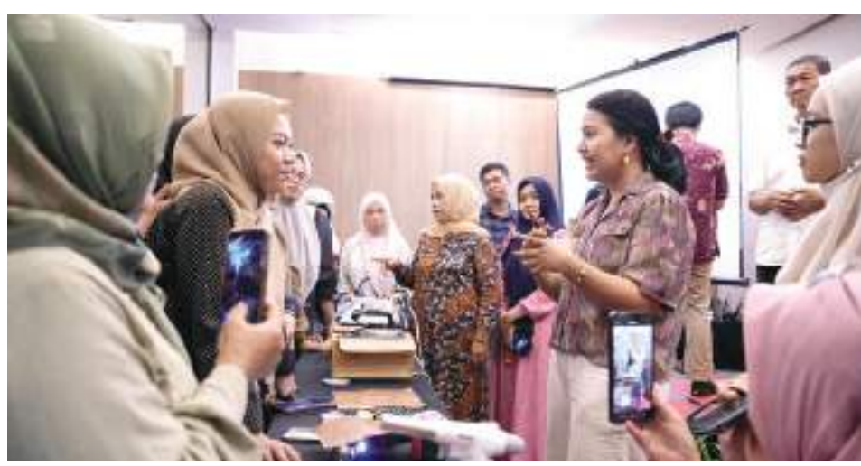
PERTAMINA Patra Niaga Regional Sulawesi melaksanakan UMK Academy 2026 di Toraja Room, Ibis City Center Makassar.

Selama dua hari, 15-16 April 2026, sebanyak 50 pelaku UMKM mengikuti pelatihan secara langsung