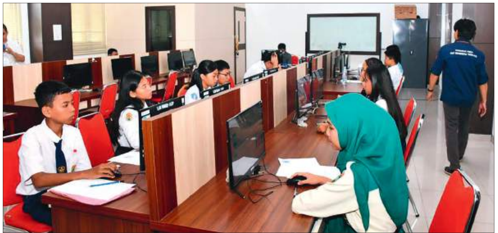
TAMPAK peserta CBT dalam rangka seleksi program Sekolah Unggul Garuda Baru tahun 2026 di Untad.

SULTENG RAYA- Universitas Tadulako (UNTAD) menjadi salah satu penyelenggara pelaksanaan tes Computer Based Test (CBT) dalam rangka seleksi program Sekolah Unggul Garuda Baru tahun 2026. Kegiatan ini diikuti oleh peserta dari berbagai daerah di Sulawesi Tengah dan dilaksanakan selama satu hari dengan dukungan fasilitas ujian berbasis komputer yang memadai serta terstandar. Pelaksanaan ujian bertempat di Laboratorium Komputer FKIP UNTAD.