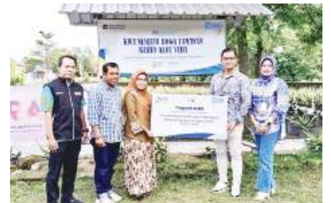
KWT Sumber Boga Tanaman.

SULTENG RAYA - Peran perempuan kini tak lagi terbatas pada mengurus rumah tangga. Perempuan kini hadir sebagai penggerak ekonomi keluarga sekaligus pendorong pemberdayaan masyarakat. Berbagai inisiatif lokal pun lahir dari kreativitas dan kolaborasi untuk membawa perubahan nyata.