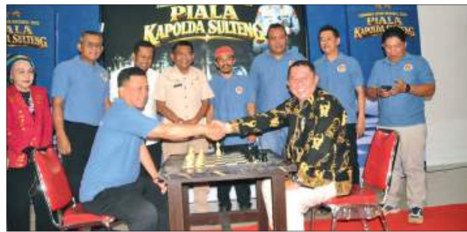
PEMBUKAAN Turnamen Catur Nasional 2026 Piala Kapolda Sulawesi Tengah, Sabtu (18/04/2026).

Dalam sambutannya, Kapolda Sulteng menyampaikan bahwa berdasarkan informasi yang diterima pada pagi hari, jumlah peserta yang telah mendaftar