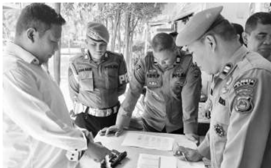
SISPROPAM Polresta Palu, saat memeriksa senpi yang dipinjam pakaikan personel, Senin (20/4/2026).

Melalui pemeriksaan tersebut, Polresta Palu berharap pengawasan terhadap penggunaan senjata api di dinas dapat semakin optimal, sehingga mendukung profesionalitas dan keamanan dalam pelaksanaan tugas kepolisian. ❏