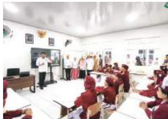
MENTERI SOSIAL RI , Saifullah Yusuf didampingi Bupati Sigi, Mohamad Rizal Intjenae, meninjau langsung proses pembelajaran Sekolah Rakyat di Sentra Nipotowe, Desa Kalukubula, Kabupaten Sigi, Senin (20/4/2026).

SULTENG RAYA - Menteri Sosial RI, Saifullah Yusuf didampingi Bupati Sigi, Mohamad Rizal Intjenae, meninjau langsung proses pembelajaran Sekolah Rakyat di lokasi rintisan Sentra Nipotowe, Desa Kalukubula, Kabupaten Sigi, Senin (20/4/2026).