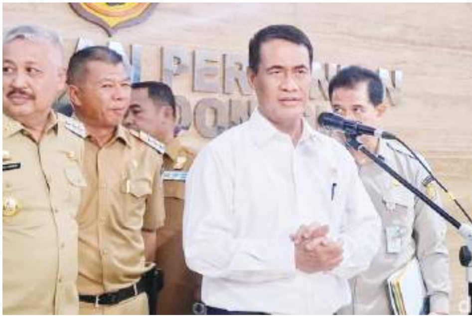
MENTERI Pertanian (Mentan) Andi Amran Sulaiman.

SULTENG RAYA - Pemerintah mengalokasikan Rp 2 triliun untuk bantuan benih padi demi mengantisipasi fenomena iklim El Nino ekstrem atau El Nino Godzilla. Menteri Pertanian (Mentan) Andi Amran Sulaiman menyampaikan bantuan tersebut sudah berjalan.