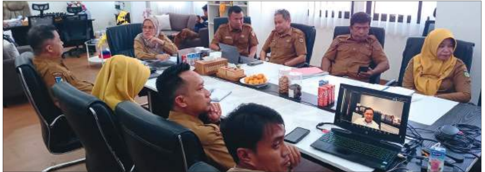
ASISTENSI, Monitoring dan Evaluasi Percepatan Capaian UCJ Kota Palu Tahun 2026, Senin (20/04/2026).

amanat Undang-Undang Nomor 59 Tahun 2024 tentang Rencana Pembangunan Jangka Panjang