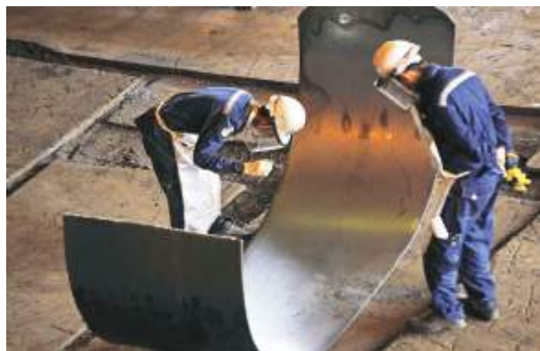
PEKERJA memeriksa kualitas lempengan baja panas (ilustrasi).

Ke depan, transformasi menuju konstruksi berkelanjutan diperkirakan akan menjadi standar baru dalam industri baja. Integrasi teknologi, efisiensi material, dan ketahanan terhadap risiko lingkungan menjadi faktor utama dalam menjaga daya saing industri nasional di pasar global. rrr