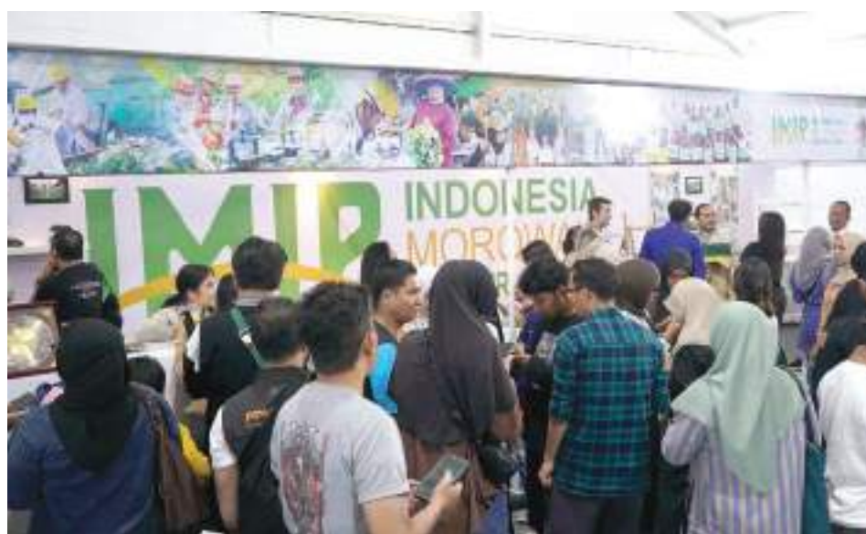
PT IMIP hadir dalam kegiatan Sulteng Expo 2026.

SULTENG RAYA - Sebagai bentuk sinergitas dan kolaborasi dengan pemerintah, PT Indonesia Morowali Industrial Park (IMIP) turut andil dalam merayakan Hari Ulang Tahun (HUT) ke-62 Sulawesi Tengah (Sulteng) di Palu. Dalam rangkaian itu, digelar event Semarak Sulteng Nambaso sebagai ajang tahunan mempertemukan berbagai sektor industri, investasi, serta program pengembangan daerah.