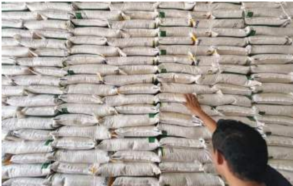
STOK beras di gudang Bulog Sulteng.

SULTENG RAYA – Perusahaan Umum Bulog Kanwil Sulawesi Tengah menyebutkan bahwa saat ini pihaknya tengah mengoptimalkan penyaluran kuota SPHP beras 2025, untuk ke-