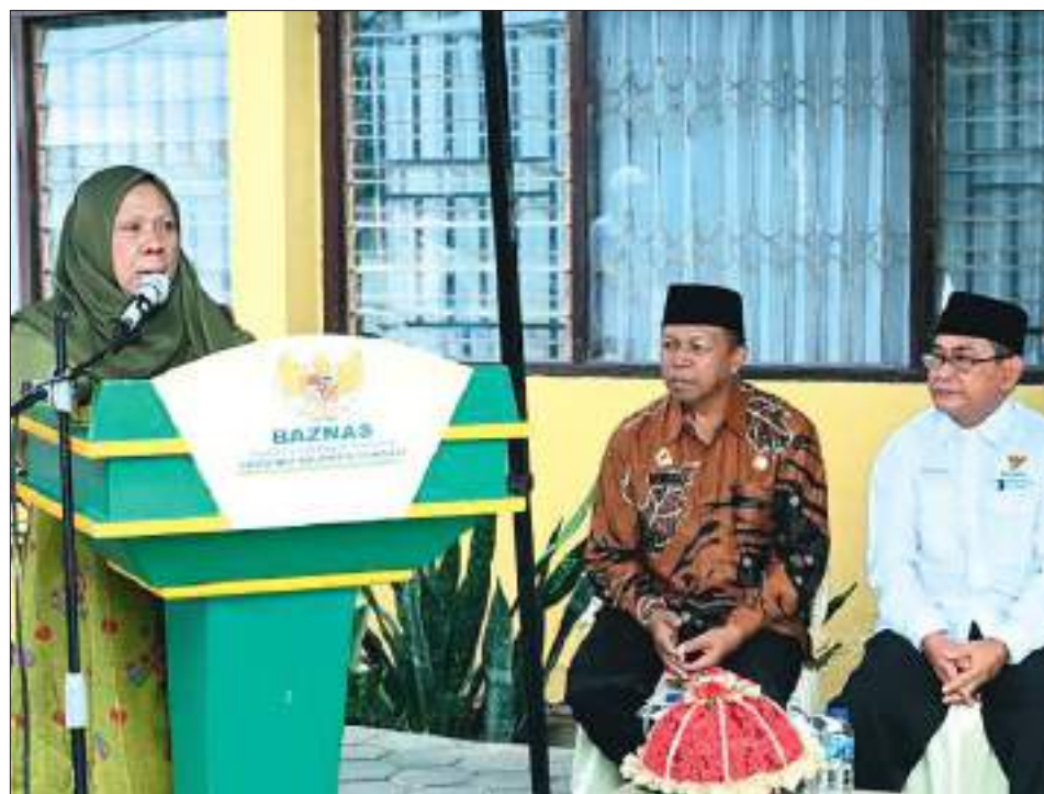
WAGUB Sulteng Reny A Lamadjido menghadiri kegiatan HUT ke-25 Baznas di Palu, Sabtu.

Acara berlangsung khidmat dan ditutup dengan tausiyah dalam rangka peringatan Isra Mi'raj Nabi Muhammad SAW, yang mengajak seluruh hadirin untuk memperkuat iman, ukhuwah, dan kontribusi nyata bagi umat dan bangsa. ABS