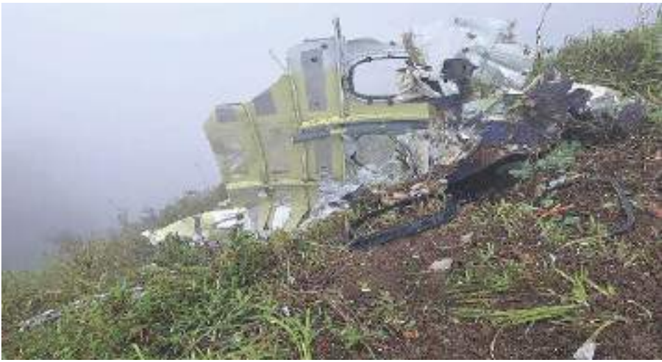
PENAMPAKAN puing-puing pesawat ATR 42-500 yang ditemukan Tim SAR Gabungan dalam operasi pencarian di Maros, Sulawesi Selatan, Indonesia, Ahad (18/1/2026).

SULTENG RAYA — Basarnas berhasil mengevakuasi satu korban pesawat ATR 42-500 yang ditemukan jatuh ke dalam jurang berkedalaman sekitar 200 meter di kawasan Bukit Bulusaraung, Kabupaten Pangkep-Maros, Sulawesi Selatan, Ahad (18/1/2026).