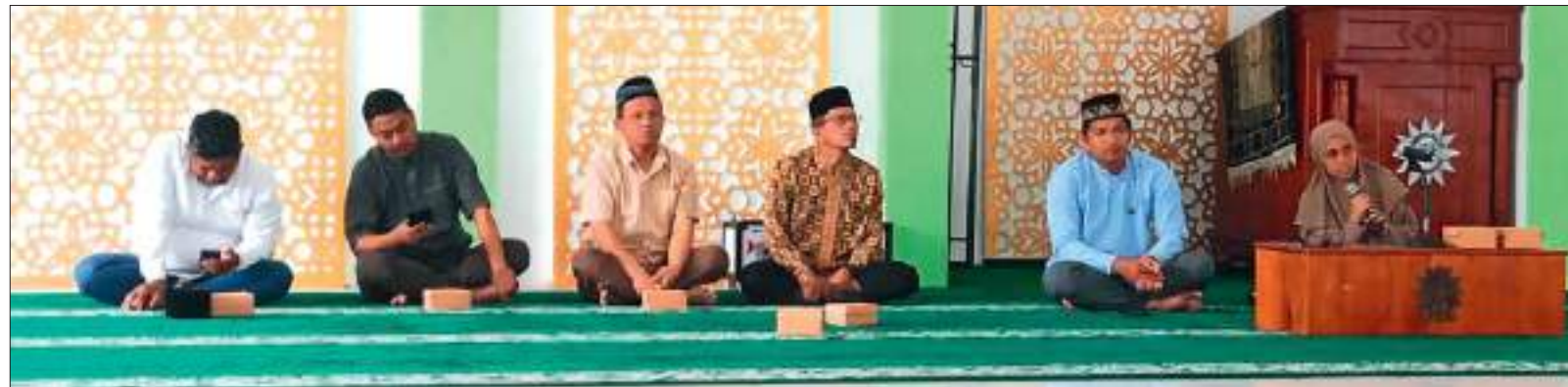
SUASANA pengajian rutin LP2AIK Unismuh Palu, di Masjid Ulil Albab Unismuh Palu, Sabtu (17/1/2026).

Ia berharap melalui pengajian rutin ini, para pendidik dan civitas akademika Unismuh Palu dapat semakin memahami pentingnya keteladanan dalam pendidikan, sehingga mampu melahirkan generasi yang berakhlak mulia dan berlandaskan nilai-nilai Islam. ENG