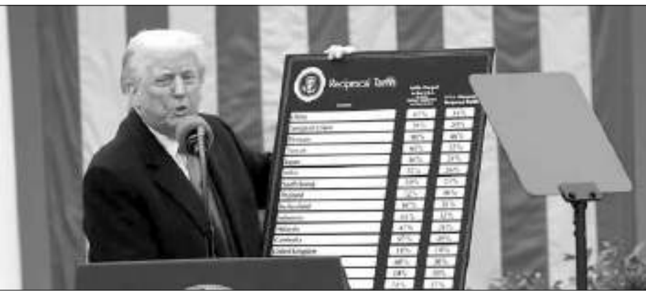
TRUMP mengangkat poster yang menampilkan tarif yang dikenakan untuk berbagai negara saat pengumuman di Gedung Putih, Rabu (3/4/2025).

SULTENG RAYA - Di tengah ekonomi Iran yang terus terpuruk akibat sanksi negara-negara Barat, Presiden AS Donald Trump kembali melayangkan pukulan. Trump mengatakan pada hari Senin bahwa negara mana pun yang melakukan bisnis dengan Iran akan menghadapi tarif sebesar 25 persen pada perdagangan dengan AS.