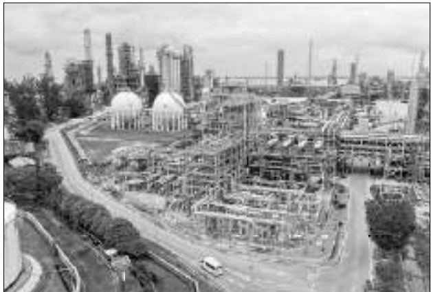
PT Pertamina (Persero) mulai memproduksi bahan bakar minyak (BBM) berstandar Euro 5 melalui proyek Refinery Development Master Plan (RDMP) Balikpapan.

dengan dua tangki penyimpanan raksasa di Lawe-Lawe dengan total kapasitas mencapai 2 juta barel, serta Terminal BBM Tanjung Batu berkapasitas 125 ribu kiloliter yang melayani distribusi BBM untuk wilayah Indonesia bagian timur.