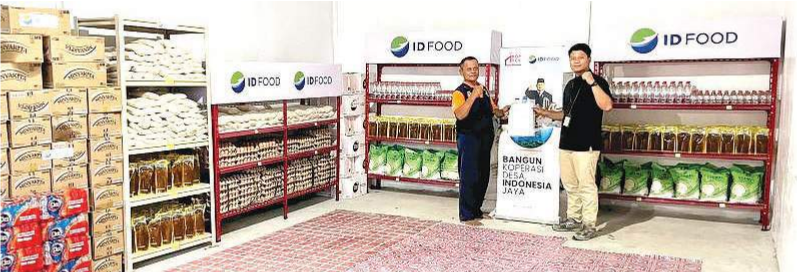
SAHAL satu gerai Koperasi Merah Putih yang telah beroperasi.

SULTENG RAYA - Pemerintah Provinsi Sulawesi Tengah (Pemprov Sulteng) mengatakan sebanyak 1.981 Koperasi Merah Putih telah terbentuk di wilayah itu dan telah memiliki legalitas lengkap.