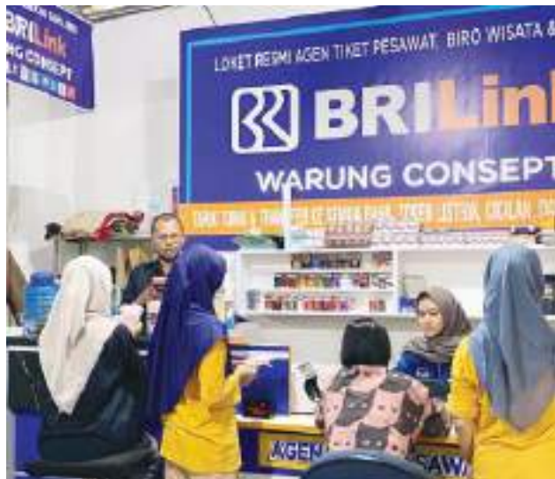
BRILink Agen Warung Concept di Desa Jambu Timur, Kecamatan Mlonggo, Kabupaten Jepara, Jawa Tengah.

Kisah BRILink Agen Warung Concept menjadi gambaran nyata bagaimana kehadiran layanan keuangan berbasis komunitas, melalui kolaborasi BRI dan masyarakat, mampu mendorong inklusi keuangan, memperkuat ekonomi lokal, serta menjadi penggerak kemandirian masyarakat