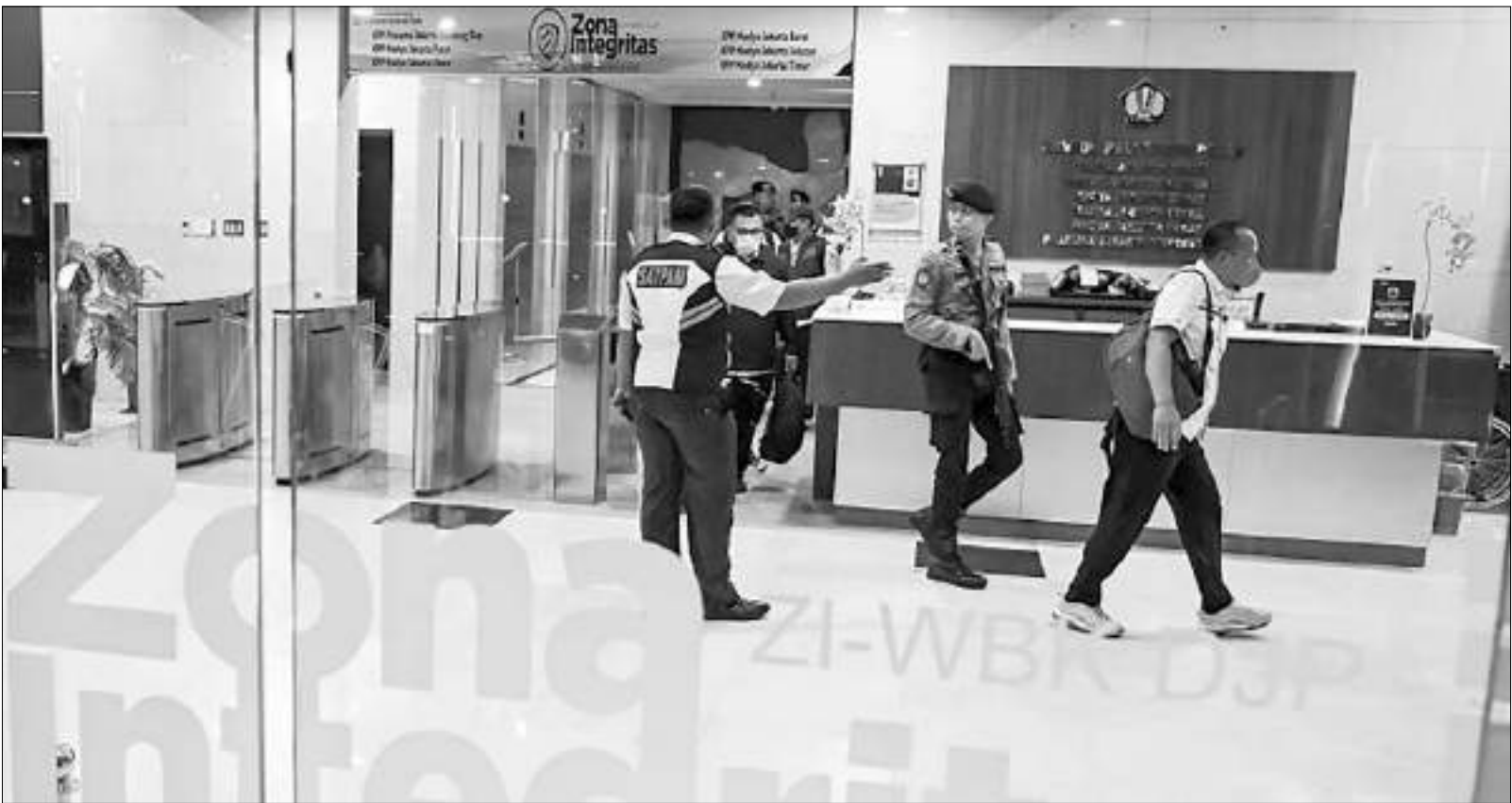
PETUGAS KPK membawa barang bukti usai melakukan penggeledahan di Kantor Pelayanan Pajak Madya Jakarta Utara, Jakarta, Senin (12/1/2026).