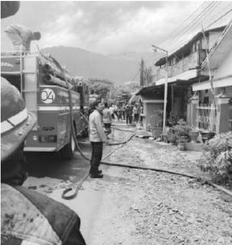
PETUGAS pemadam kebakaran berupaya memadamkan kobaran api yang melanda sebuah rumah di Kelurahan Pengawu, Minggu (18/1/2026) siang.

Dia juga mengimbau masyarakat untuk meningkatkan kewaspadaan terhadap potensi kebakaran rumah. “Kami mengingatkan masyarakat agar memastikan instalasi listrik di rumah dalam kondisi aman dan sesuai standar guna mencegah terjadinya kebakaran,” imbuhnya. AMR