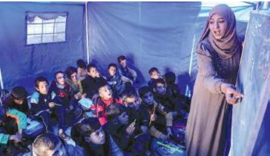
PARA SISWA di Sekolah Pendidikan Al-Shamal, yang terletak hanya 100 meter dari “Garis Kuning” di Kamp Pengungsi Jabalia, Jalur Gaza utara pada 12 Januari 2026.