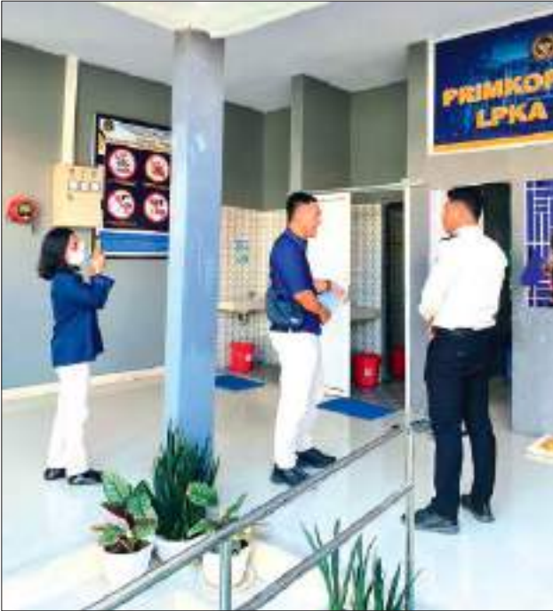
TIM Survei Internal KPKNL Palu saat melakukan peninjauan lapangan terkait pemanfaatan Barang Milik Negara (BMN), khususnya pada area gedung dan bangunan kantin dan koperasi konsumsi di kantor LPKA Palu pada Rabu (14/1/2026).

SULTENG RAYA - Lembaga Pembinaan Khusus Anak (LPKA) Kelas II Palu Kantor Wilayah Direktorat Jenderal Pemasyarakatan Sulawesi Tengah, menerima kunjungan kerja dari Tim Survei Internal Kantor Pelayanan Kekayaan Negara dan Lelang (KPKNL) Palu pada Rabu (14/1/2026). Kunjungan ini bertujuan untuk melakukan peninjauan lapangan terkait pemanfaatan Barang Milik Negara (BMN), khususnya pada area gedung dan bangunan kantin dan koperasi konsumsi. Langkah ini merupakan