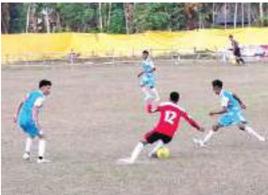
PERTANDINGAN Khatulistiwa Lemusa menghadapi Pasir Putih Tumpapa di lapangan Patriot Bambalemo, Minggu sore (18/1/2026).

SULTENG RAYA – Laga hidup-mati tersaji di Lapangan Patriot, Desa Bambalemo, Minggu sore (18/1/2026). Khatulistiwa Lemusa tampil solid dan penuh determinasi untuk menyingkirkan Pasir Putih Tumpapa dengan skor tipis 3-2 pada lanjutan Turnamen Sepakbola Gubernur BERANI Cup 2026.