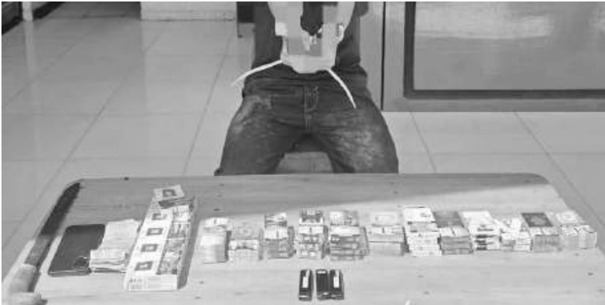
PELAKU pencurian mini market Indomaret di Kelurahan Kayumalue, saat diamankan di Mapolsek Tawaeli bersama beberapa barang bukti, Minggu (18/1/2026).