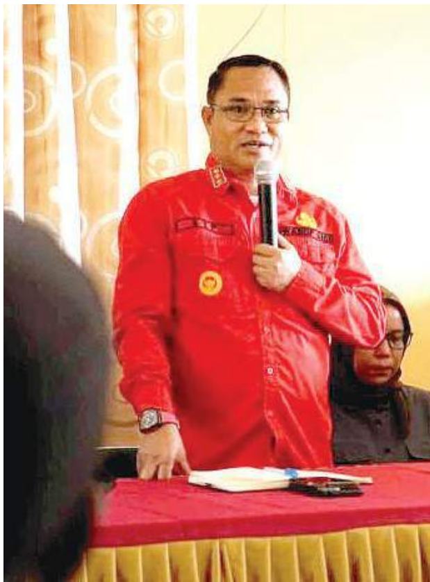
WAKIL Bupati Sigi Samuel Yansen Pongi.