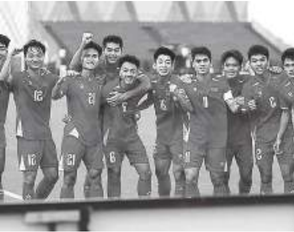
VIETNAM bakal bertarung melawan China di semifinal Piala Asia U-23 2026.

SULTENG RAYA - Vietnam bakal dikepung oleh raksasa Asia Timur di babak semifinal Piala Asia U-23 2026. Berikut daftar empat tim negara yang berhasil lolos ke semifinal Piala Asia U-23 2026. Dua tim yang memastikan diri lolos ke semifinal pada laga Sabtu (17/1)