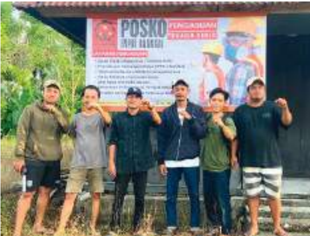
SEJUMLAH pengurus PK FNPBI Banggai saat berpose bersama di depan Posko Pengaduan Tenaga Kerja.