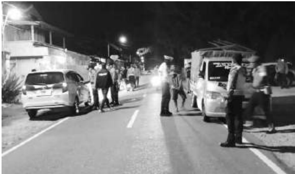
SEJUMLAH personel Polres Sigi, saat melaksanakan patroli di lokasi keramaian, Sabtu (17/1/2026).

Ia menambahkan, kehadiran personel Polri di tengah masyarakat diharapkan mampu memberikan rasa aman dan nyaman serta meminimalisir potensi gangguan kamtibmas sehingga situasi tetap aman dan kondusif. AMR