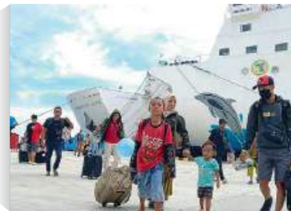
PENUMPANG KM Dharma Kencana V di pelabuhan Donggala, Sulawesi Tengah saat hendak mudik lebaran Idul Fitri 1446 Hijriah, Rabu (26/3/2025).

SULTENG RAYA - Kantor Kesyahbandaraan dan Otoritas Pelabuhan (KSOP) Kelas II Teluk Palu Wilayah Kerja Donggala, mencatat puncak arus mudik di Pelabuhan Donggala terjadi pada 26 Maret 2025 dengan total 1.500 penumpang yang menggunakan angkutan laut dari Palu tujuan Surabaya.