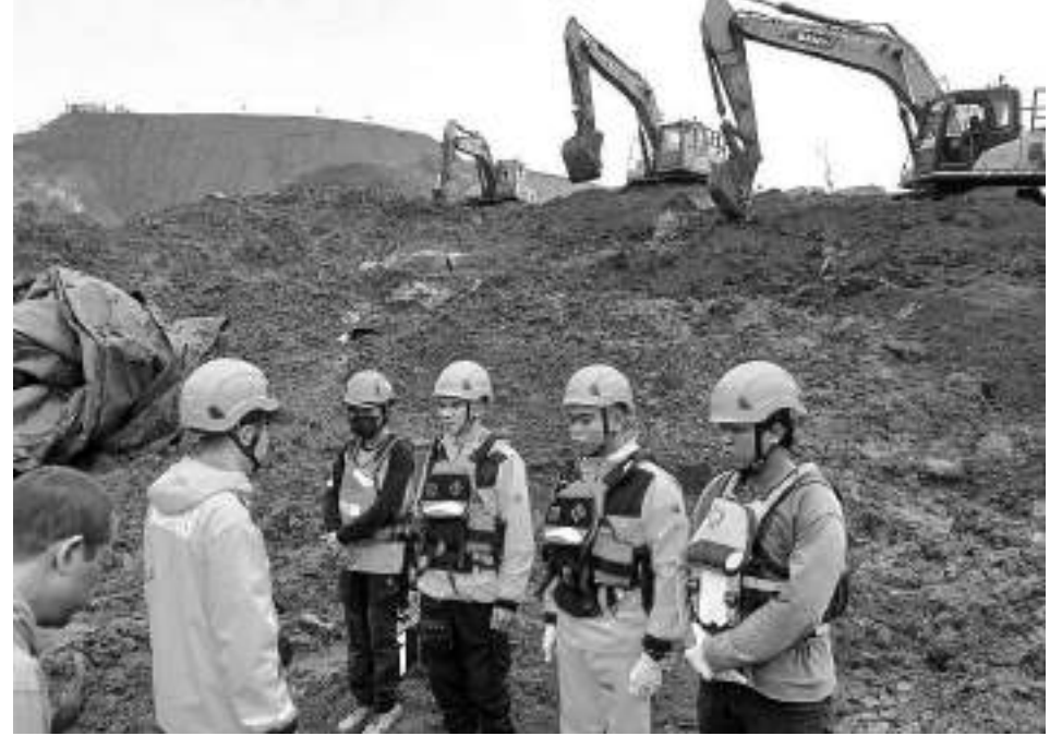
TIM SAR sabungan melakukan pencarian korban tertimbun longsor limbah industri di kawasan PT IMIP di Kabupaten Morowali, Sulawesi Tengah, Rabu (26/3/2025).

tim rescue Pos SAR Morowali dibantu lima personel Kantor SAR Palu," kata Kepala Kantor SAR pencarian dan Pertolongan Palu Muh