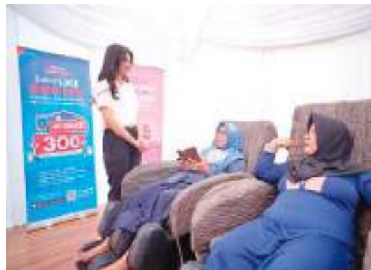
SERAMBI MyPertamina menyediakan layanan kursi pijat gratis, membantu mengurangi kelelahan pemudik sebelum kembali melanjutkan perjalanan.

SULTENG RAYA - Dalam rangka mendukung kenyamanan masyarakat selama arus mudik Idulfitri 1446 H, Pertamina Patra Niaga Regional Sulawesi kembali menghadirkan Serambi MyPertamina sebagai bagian dari layanan ekstra selama masa Satgas Ramadan & Idul Fitri (RAFI) 2025.