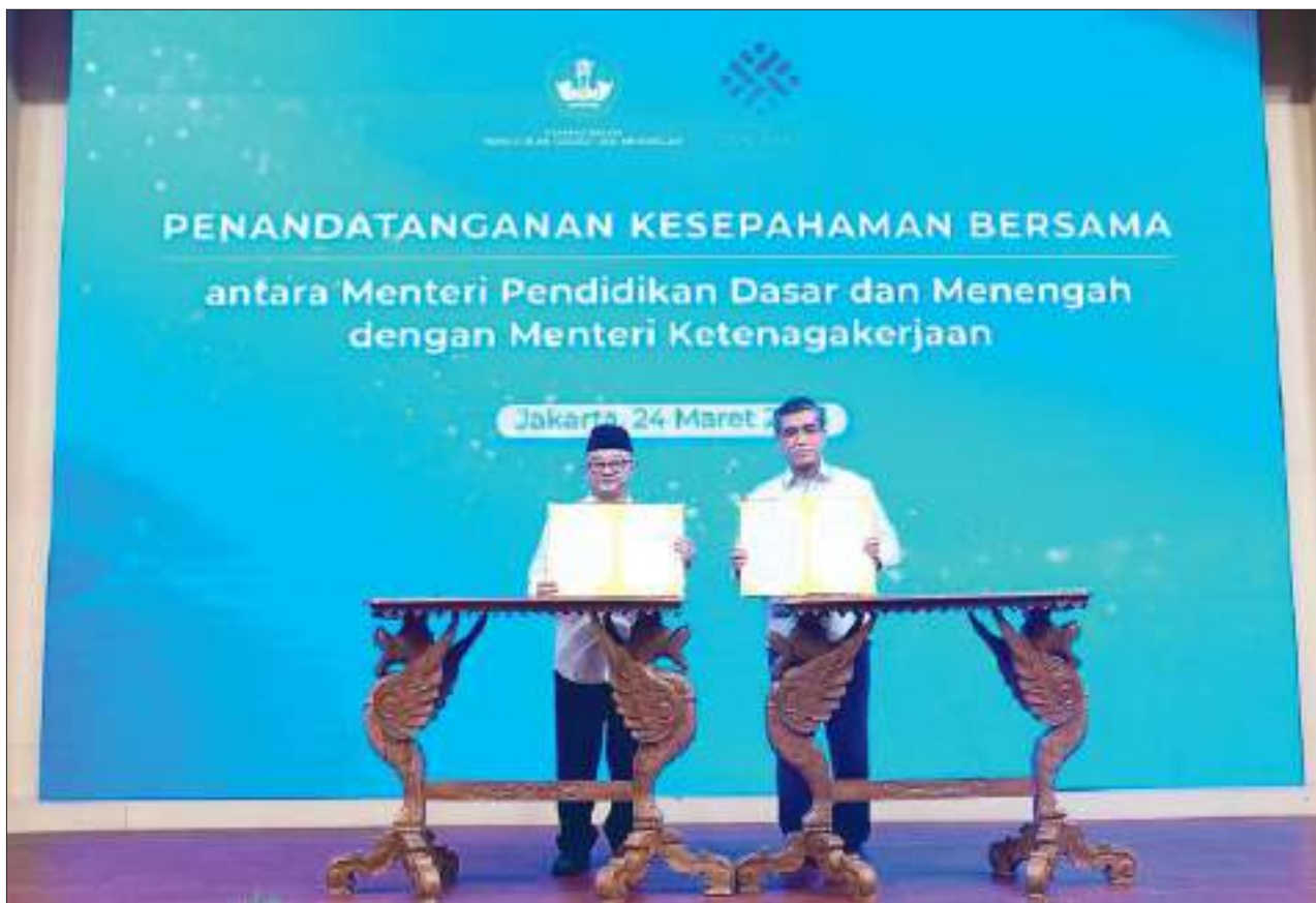
PENANDATANGANAN kerja sama Kemendikdasmen, Kementerian Ketenagakerjaan (Kemenaker) dan Kementerian Pelindungan Pekerja Migran Indonesia (KP2MI)/Badan Pelindungan Pekerja Migran Indonesia (BP2MI) di Kantor Kemendikdasmen, Jakarta, Senin (24/3/2025).

SULTENG RAYA- Kementerian Pendidikan Dasar dan Menengah (Kemendikdasmen) berupaya membuka kesempatan yang lebih luas bagi lulusan