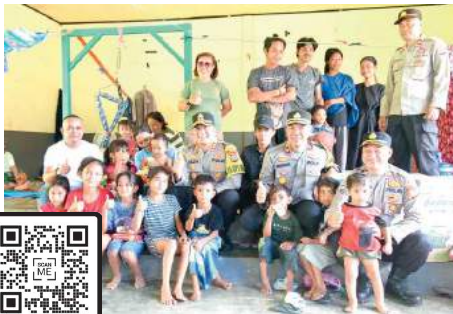
KAPOLRES MORUT , AKBP Reza Khomeini mengunjungi dan memberikan bantuan sembako kepada para pengungsi banjir yang ditampung di Balai Desa Bunta, Kecamatan Petasia Timur, Rabu (26/3/2025).

SULTENG RAYA - Kapolres Morowali Utara, AKBP Reza Khomeini, S.I.K. bersama Wakapolres, Kasat Binmas dan KBO Satintelkam Polres Morowali Utara memberikan bantuan sembako kepada para pengungsi banjir yang ditampung di Balai Desa Bunta, Kecamatan Petasia Timur, Rabu (26/3/2025).