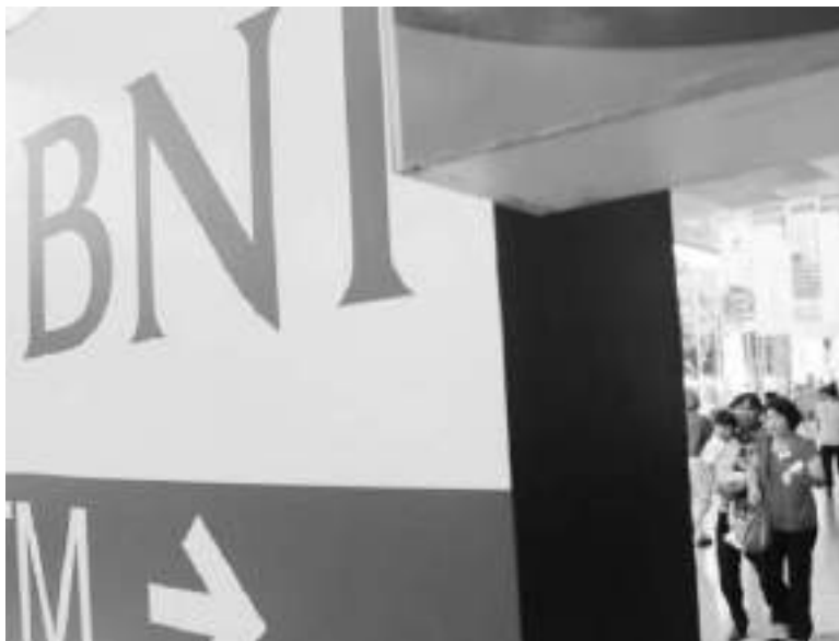
BNI. PT Bank Negara Indonesia (Persero) Tbk (BBNI) menyetujui pembelian kembali (buyback) saham yang telah dikeluarkan dan tercatat di Bursa Efek Indonesia (BEI).

Kebijakan ini dapat meningkatkan kepercayaan pelaku pasar, mengurangi tekanan, serta merupakan tindak lanjut dari pertemuan dengan para pemangku kepentingan di pasar modal yang telah diselenggarakan pasal 3 Maret 2025. KOI