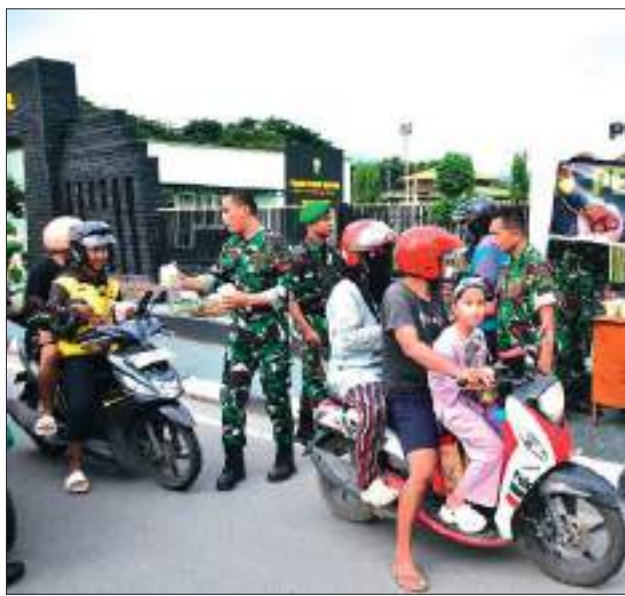
PRAJURIT Korem 132/Tdl saat menggelar pembagian takjil Gratis bagi masyarakat sekitar, bertempat di depan Makorem 132/Tdl, Ahad (24/3/2025).

Semoga semangat berbagi ini terus membawa manfaat dan keberkahan bagi semua. 77AT