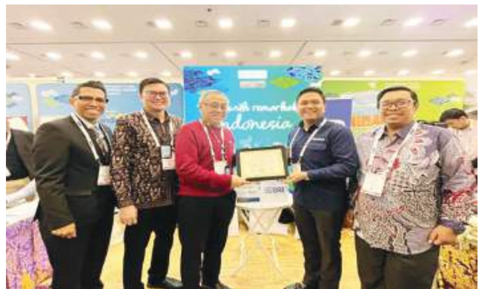
NATURAL Product Expo West (NPEW) 2025, yang berlangsung di Anaheim, California, Amerika Serikat.

Selama tiga hari pameran, ketiga UMKM binaan BRI berhasil mencatatkan potensi transaksi (potential deals) dengan nilai yang menjanjikan, yaitu Total potensi deal yang berhasil dicatatkan mencapai USD 754.800 atau sekitar Rp28 miliar. Keber-