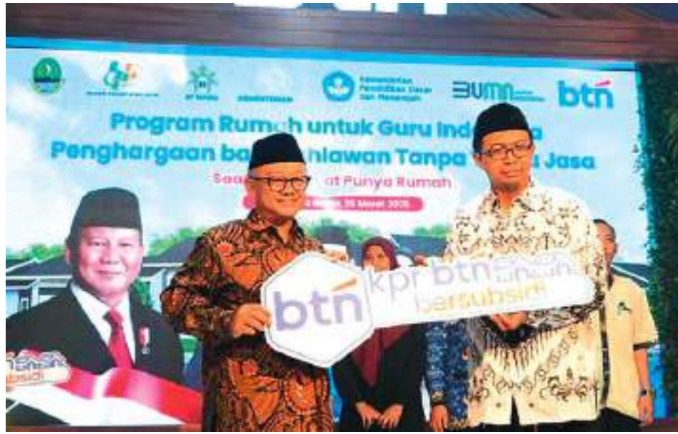
LIMA kementerian-lembaga realisasi program rumah untuk guru Indonesia.

SULTENG RAYA- Pemerintah melalui lima kementerian-lembaga termasuk Kementerian Pendidikan Dasar dan Menengah (Kemendikdasmen) wujudkan Program Rumah untuk Guru Indonesia. Program ini dimulai dengan penandatanganan nota kesepahaman (MoU) sekaligus serah terima kunci rumah bersubsidi.