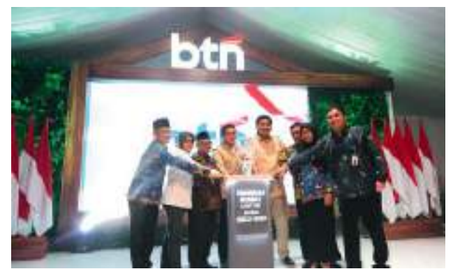
PEYERAHAN kunci rumah subsidi untuk para guru melalui Program Rumah untuk Guru Indonesia di Perumahan Pesona Kahuripan 11, Cileungsi, Kabupaten Bogor, Jawa Barat, Selasa (25/3/2025).

"Mudah-mudahan (program ini) bermanfaat dan mudah-mudahan para guru dengan berbagai peningkatan kesejahteraan dan layanan pendidikan dapat bekerja lebih baik lagi, fokus pada pembelajaran, fokus pada tugas bapak-bapak Ibu sekaligus sebagai pendidik," pungkaskan Mu'ti. KPS