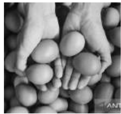
KOMODITI telur.

"Seperti yang sudah disampaikan oleh Menteri Pertanian (Mentan) Andi Amran Sulaiman, pemerintah terus menjaga stok dan harga komoditas pangan strategis, termasuk telur. Alhamdulillah, berkat kerja keras semua pihak, terutama petani dan peternak, pada Ramadan dan Lebaran kali ini, stok dan harga sembilan komoditas pangan strategis