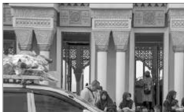
SEJUMLAH pemudik beristirahat di halaman Masjid Babussalam, Kersamanah, Kabupaten Garut, Jawa Barat, Rabu (19/4/2023).

SULTENG RAYA - Kementerian Agama (Kemenag) menyiapkan ribuan posko Masjid Ramah di jalur mudik yang tersebar di puluhan provinsi di Indonesia. Posko berbasis masjid ini disiapkan untuk membantu kelancaran dan kenyamanan para pemudik pada lebaran 1446 H/2025 M.