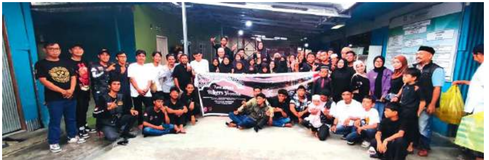
MAIN Dealer Honda Anugerah Perdana bersama Paguyuban Ikatan Motor Honda Palu (IMHP) saat berpose bersama anak-anak di Panti Asuhan Al-Mabrukah, Silae, Kota Palu, dalam acara sosial bertajuk Ramadan Bikers Honda.

SULTENG RAYA - Main Dealer Honda Anugerah Perdana bersama Paguyuban Ikatan Motor Honda Palu (IMHP) baru-baru ini kembali mengadakan acara sosial bertajuk Ramadan Bikers Honda.