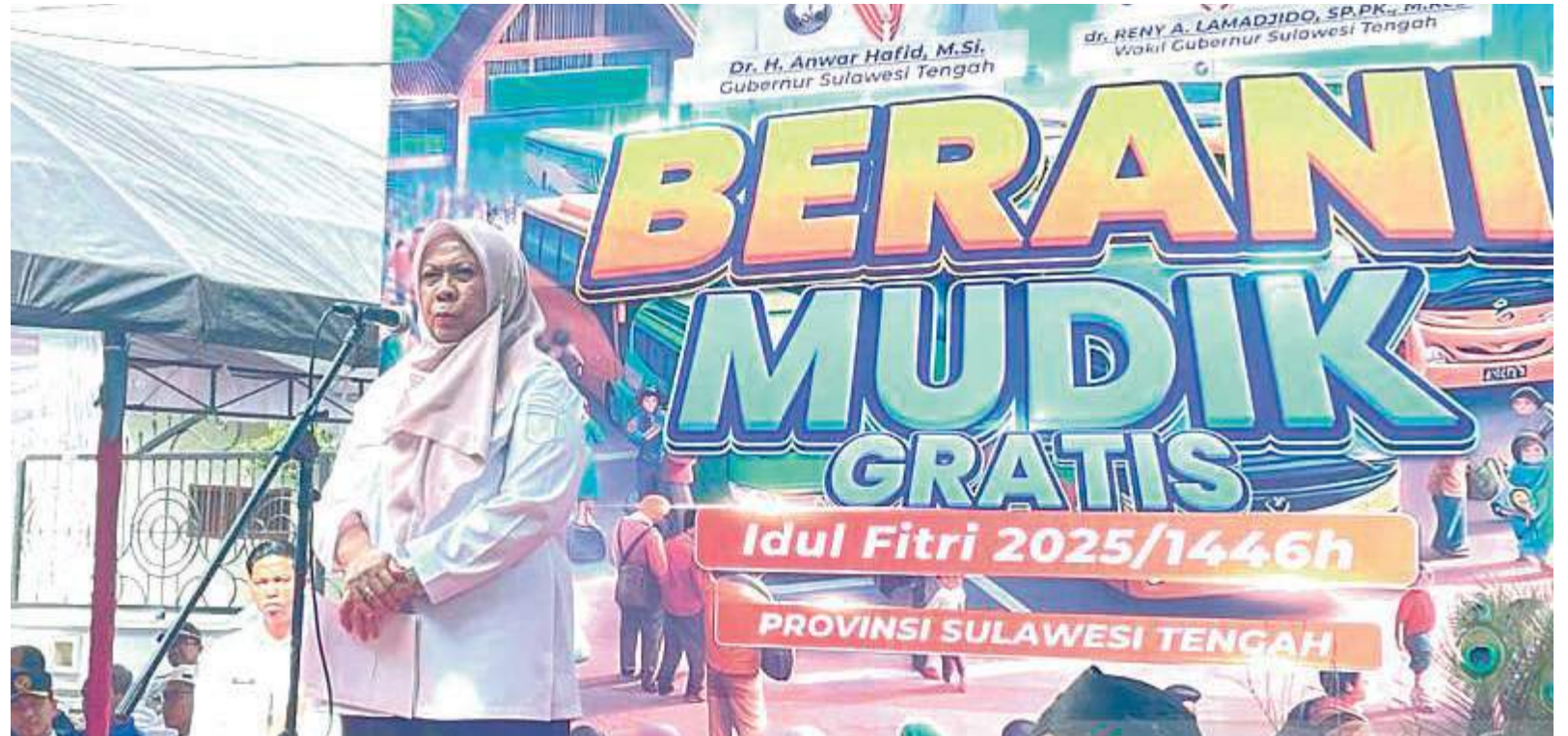
WAKIL GUBERNUR Sulawesi Tengah Reny A Lamadjido menyampaikan sambutannya saat melepas rombongan peserta mudik dalam program Berani Mudik Gratis Idul Fitri 2025 yang diinisiasi Pemerintah Provinsi Sulteng, Rabu (26/3/2025).

SULTENG RAYA - Wakil Gubernur Sulawesi Tengah (Wagub Sulteng) Reny A Lamadjido melepas rombongan peserta Berani Mudik Gratis Idul Fitri 2025, program mudik gratis yang diinisiasi pemerintah daerah (pemda) setempat.