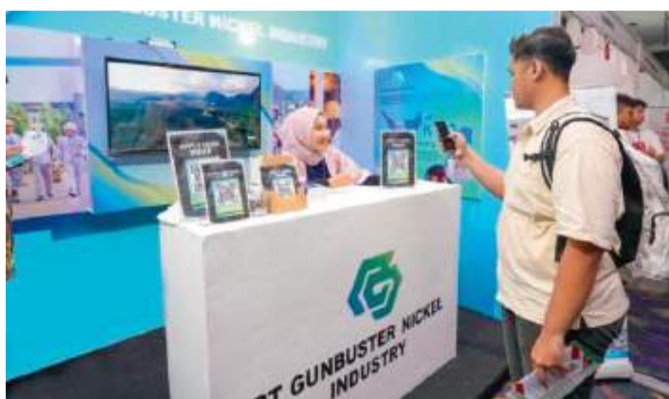
PT GNI Berpartisipasi dalam Mandarin Job Fair 2024 di Jakarta.