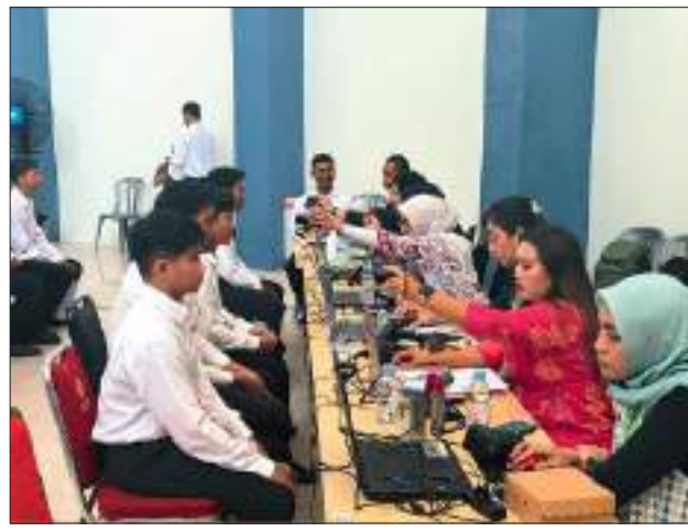
PESERTA CPNS Kemenkumham Sulteng saat menjalani pengenalan wajah atau face recognition dalam proses seleksi SKD.

Dengan memanfaatkan teknologi face recognition, Kanwil Kemenkumham Sulteng berhasil meningkatkan keamanan dan integritas pelaksanaan SKD. Sistem ini berfungsi untuk memverifikasi identitas peserta secara akurat dengan membandingkan wajah peserta yang terdaftar dengan data yang ada dalam sistem. "Penggunaan teknologi face recognition ini merupakan langkah untuk mencegah terjadinya praktik