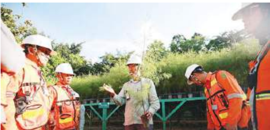
INSAN PT Vale Blok Sorowako saat menjelaskan mekanisme rehabilitasi yang dilakukan perusahaan kepada pengunjung dari Forum KTT di Nursery.

SULTENG RAYA - Industri pertambangan saat ini dihadapkan pada tantangan untuk menyeimbangkan efisiensi operasional dengan tanggung jawab sosial.