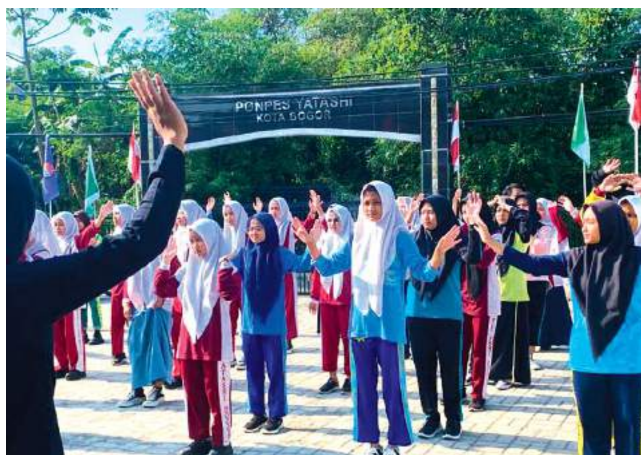
PROGRAM Studi (Prodi) Fisioterapi, Pendidikan Vokasi, UI memperagakan senam dismenore untuk mengatasi nyeri sendi saat menstruasi kepada remaja putri di Madrasah Aliyah Swasta Yatashi Kota Bogor.

Hal tersebut didukung oleh data Riset Kesehatan Dasar (Riskesdas) Kementerian Kesehatan RI pada 2018 yang menunjukkan preva-