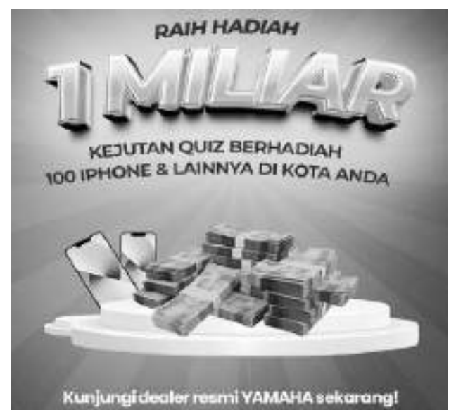
FLYER informasi program promo dari Yamaha Indonesia.

"Melalui program ini, kami ingin memberikan apresiasi kepada pelanggan setia Yamaha yang selalu mendukung dan mempercayai produk kami. Selain berkesempatan mendapatkan motor Yamaha impian, pelanggan juga bisa menjadi miliarder," katanya.