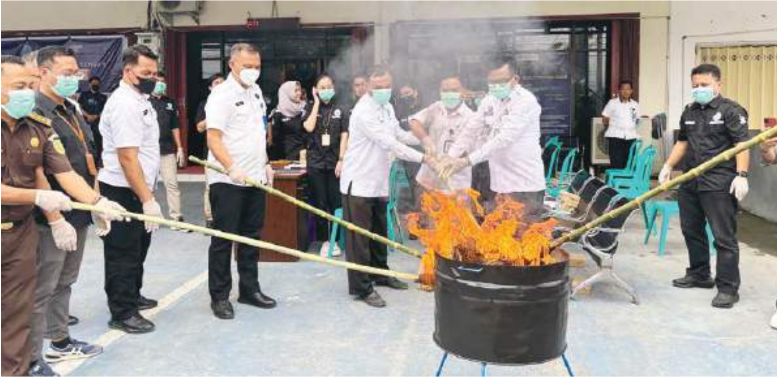
BNN Provinsi Sulteng melakukan pemusnahan barang bukti narkotika jenis ganja dengan cara dibakar di halaman kantor BNN Sulteng, Jalan Dewi Sartika, Kota Palu, Rabu (30/10/2024).

SULTENG RAYA - Badan Narkotika Nasional (BNN) Provinsi Sulawesi Tengah (Sulteng) melaku-