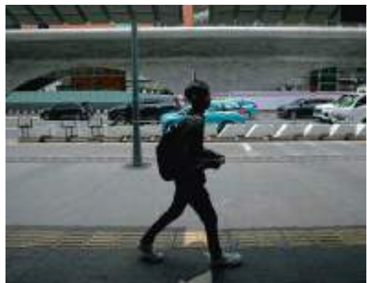
ILUSTRASI. BMKG memberi peringatan sejumlah daerah terdampak suhu panas yang berpotensi 'memanggang' RI.

SULTENG RAYA - Badan Meteorologi, Klimatologi, dan Geofisika (BMKG) memberi peringatan sejumlah daerah terdampak suhu panas yang berpotensi 'memanggang' RI. Menurut BMKG, suhu di sejumlah daerah dapat mencapai 37 hingga 38,4 derajat Celsius.