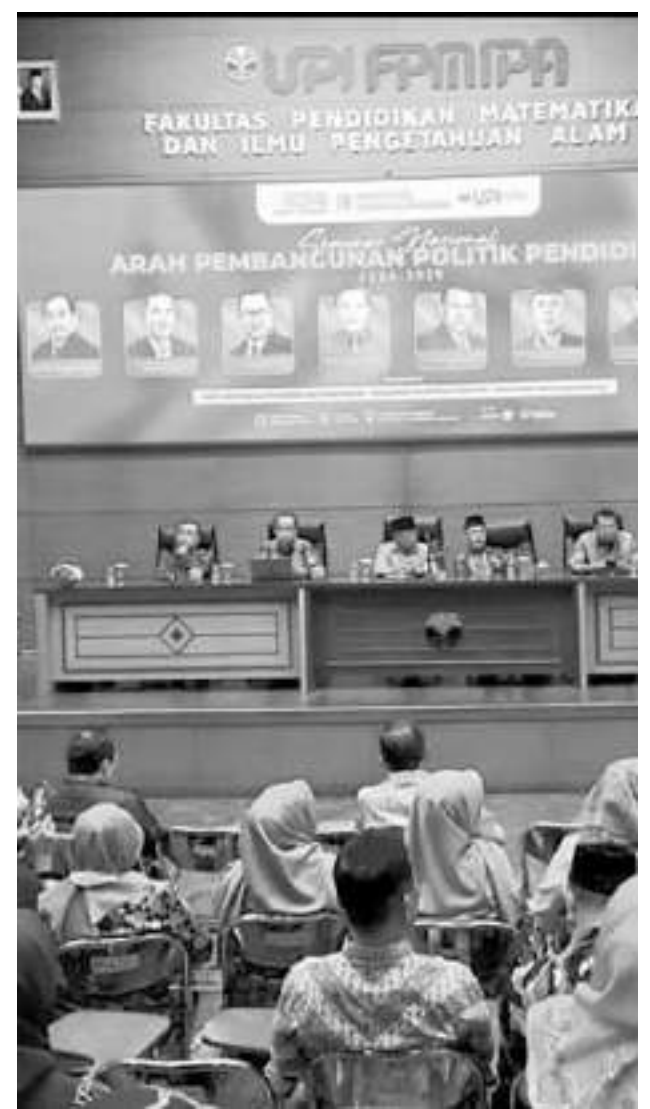
IKATAN Cendekiawan Muslim Indonesia (ICMI) bekerja sama dengan Universitas Pendidikan Indonesia (UPI) dan Universitas Teknologi Bandung (UTB) menggelar seminar nasional dengan tema arah pembangunan politik pendidikan tahun 2024-2029 di Auditorium FPMIPA UPI, Kota Bandung, Jumat (25/10/2024).

1. Mendorong agar pemerintah dan DPR segera melakukan penataan regulasi melalui revisi undang-undang Republik Indonesia nomor 20 Tahun 2003 tentang Sistem Pendidikan Nasional (UU Sisdiknas). UU Sisdiknas ini telah berlaku kurang lebih dua puluh satu tahun sehingga memerlukan politik hukum pendidikan yang