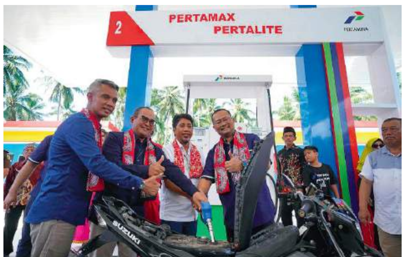
PERESMIAN BBM satu harga di Tinangkung Selatan, Bangkep, Rabu (30/10/2024).

Peresmian dilakukan secara serentak di 4 lokasi diantaranya Ternate untuk klaster Maluku Papua, Pa-