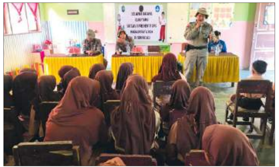
PERSONEL Satgas III Preventif Operasi Madago Raya saat memberikan edukasi kepada siswa tentang bahaya penyalahgunaan obat terlarang, bullying dan wawasan kebangsaan di SDN Pasau yang terletak di Desa Tiwaa, Kecamatan Poso Pesisir, pada Sabtu (26/10/2024).

SULTENG RAYA - Dalam upaya mendukung pendidikan dan membangun kesadaran kebangsaan di kalangan pelajar, Satgas III Preventif Operasi Madago Raya mengunjungi SDN Pasau yang terletak di Desa Tiwaa, Kecamatan Poso Pesisir, pada Sabtu (26/10/2024).