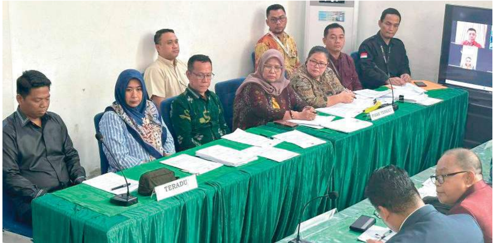
SIDANG dugaan pelanggaran Kode Etik Penyelenggara Pemilu (KEPP) oleh DKPP RI di Kantor Bawaslu Sulteng, Kota Palu, Selasa (29/10/2024).

SULTENG RAYA - Dewan Kehormatan Penyelenggara Pemilu (DKPP) RI menggelar sidang pemeriksaan dugaan pelanggaran Kode Etik Penyelenggara Pemilu (KEPP) untuk ketua dan anggota Komisi Pemilihan Umum Kabupaten Poso, Sulawesi Tengah.