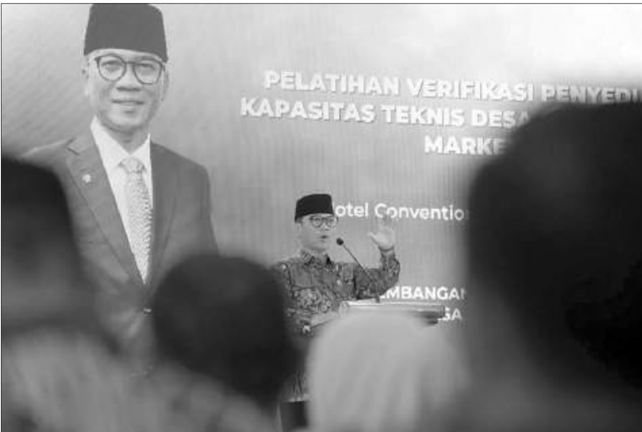
MENTERI Desa dan Pembangunan Daerah Tertinggal (Mendes PDT), Yandri Susanto, saat membuka Pelatihan Tim Verifikasi Penyedia Peningkatan Kapasitas Teknis Desa (P2KTD), Ahad (27/10/2024).