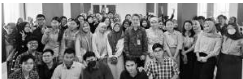
FOTO bersama pada kegiatan kuliah umum kepala BPOM di Palu kepada mahasiswa Fakultas Kedokteran Universitas Tadulako (Untad), Senin (28/10/2024).

SULTENG RAYA - Kepala Balai POM di Palu, Mardianto, memberikan kuliah umum kepada mahasiswa Fakultas Kedokteran Universitas Tadulako (Untad) pada Senin (28/10/2024).